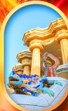
ปาร์ค กูเอล