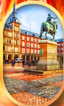
พลาซามายอร์