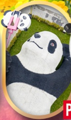
หมีแพนด้าเซลฟ์