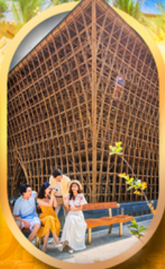
อาคารไม้ไผ่