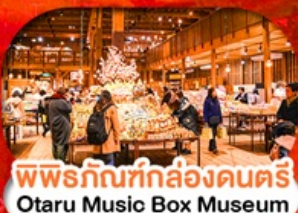
พิพิธภัณฑ์กล่องดนตรี Otaru Music Box Museum