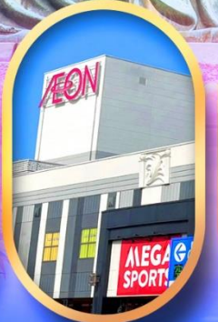
อีออนมอล