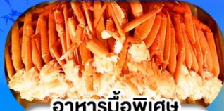
อาหารมือพิเศษ บุฟเฟ่ต์ขาปู