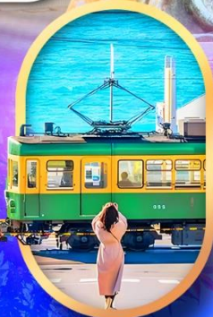
ถนนโคมาจิโดริ