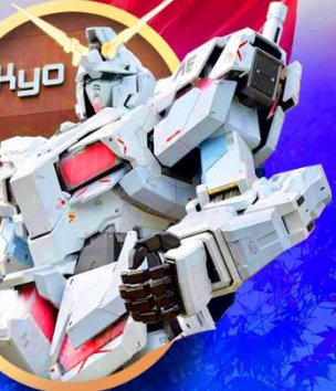
ห้างไอโดปะกันดั้ม