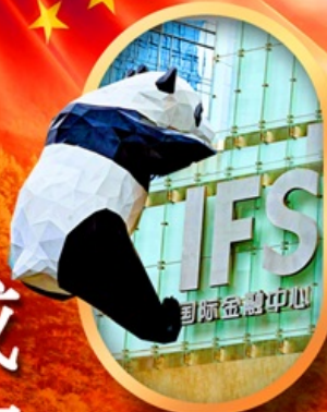
IFS หมีแพนด้าป็นติก