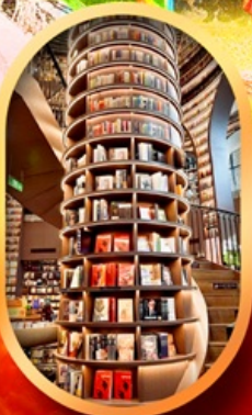
อุทยานปี้เฉิงโกว