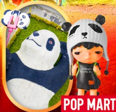
หมีแพนด้าเซลฟี