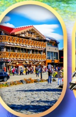
ภูเขาไฟฟูจิ ชั้น 5