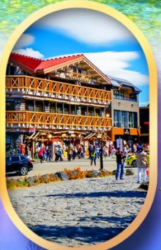
ภูเขาไฟฟูจิ ชั้น 5