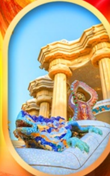
ปาร์ค กูเอล