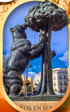
อนุสาวรีย์หมี