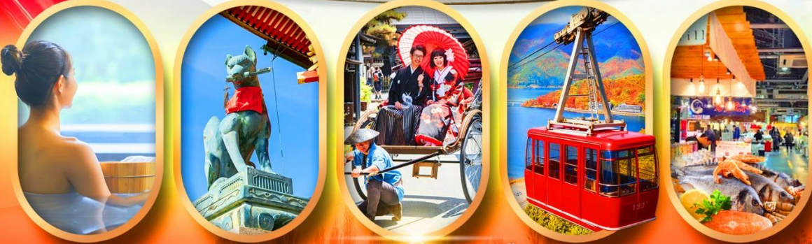
พักโรงแรมออนเซ็น ศาลเจ้าจิ้งจอก เมืองเก่าทาคายาม่า ขึ้นกระเช้าทะเลสาบมิกะตะ ตลาดปลาโงโคะ