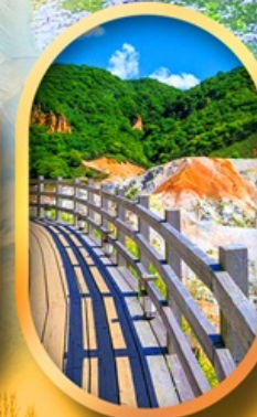
โนโบริเบ็ทสึ