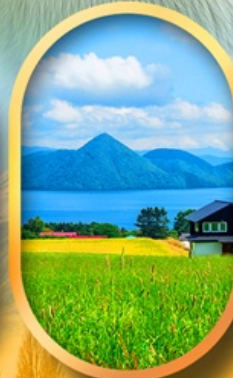
ทะเลสาบโทโยะ