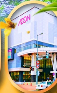
อีออนมอลล์