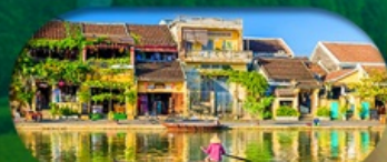
HoiAn Ancient Town ย่านเมืองเก่าฮอยอัน