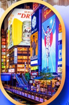
ย่านชินโซบาชิ