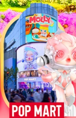
ช้อปปิ้งถนนหนางจิง