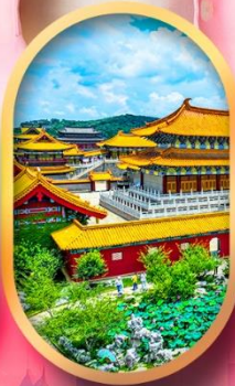
เมืองจำลองสามก๊ก