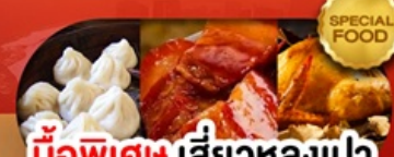
มือพิเศษ เสี้ยวหลงเปา หมูตงพอ ไก่จอกาน เดินทาง ม.ค. - มิ.ย. 69