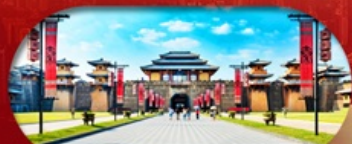
Hengdian World Studios โรงละครจำลองที่ใหญ่ที่สุดในโล

เซี่ยงไฮ้ หางโจว หิงเตี้ยน ล่องเรือทะเลสาบซีหู