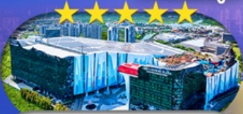
Crowne Plaza Snow World Hotel หรือเทียบเท่า S+ดีบี 5 ดาว 1 คืน

เชียงใหม่ ดิสนีย์แลนด์ ไอซ์แอนดส์โนวเวิลด์