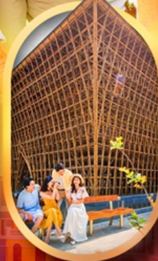
อาคารไม้ไผ่