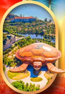
พิพิธภัณฑ์สัตว์น้ำ