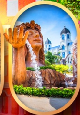
น้ำตกเทพพิหญิง