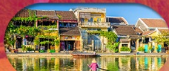
HoiAn Ancient Town ย่านเมืองเก่าฮอยอัน