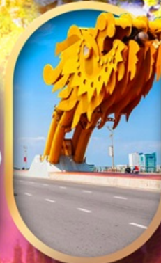
สะพานมังกรดานัง