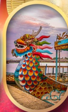
ล่องเรือมังกรแม่น้ำหอม