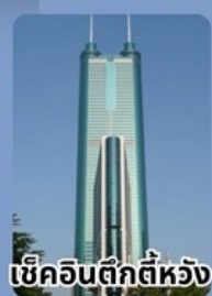
เข็ควินตึกตีห้วง