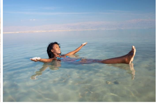
แวะถ่ายรูปที่จุดชมวิว Salty Rock