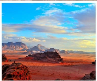
ทะเลทรายวาดี รัม