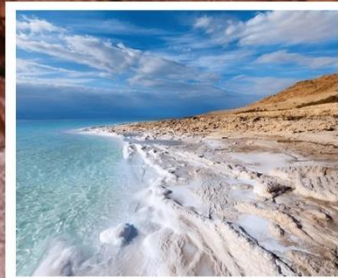
ทะเลสาบเดดซี