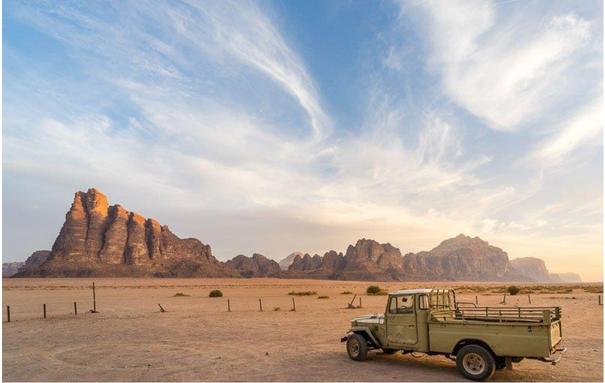
พาท่านเที่ยวชม Red Sand Dune ชมแผ่นดินทรายสีแดง และ สะพาน Burdah Rock Bridge