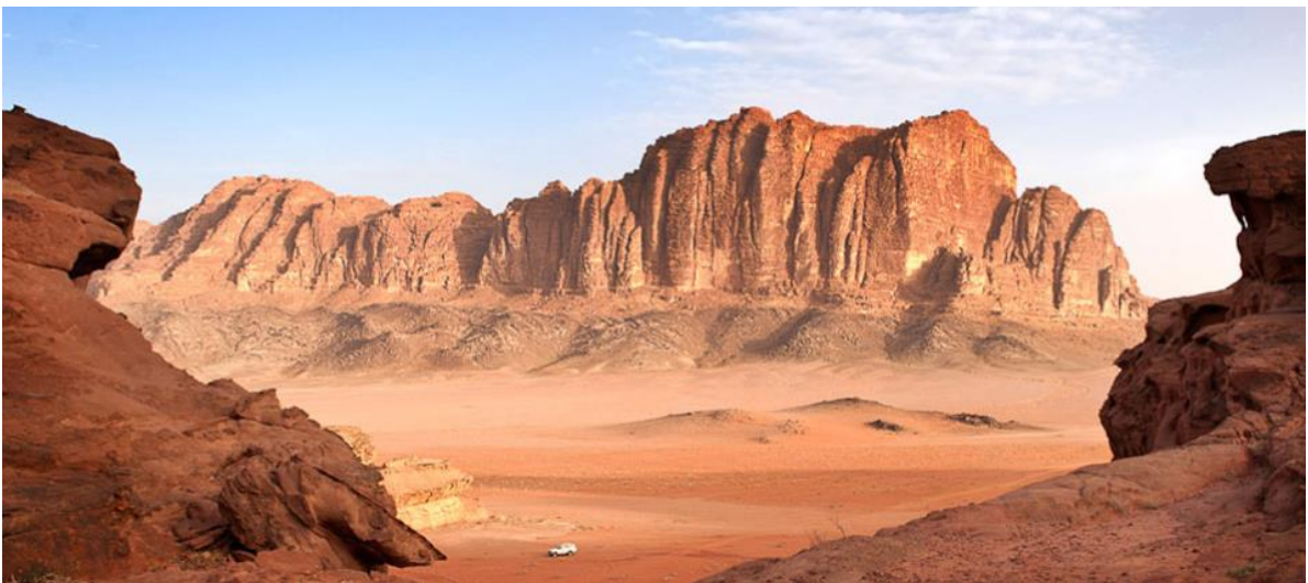
พาท่านเที่ยวชมภูเขาลูกแรก Seven Pillars of Wisdom

เช้า รับประทานอาหารเช้า ณ โรงแรมที่พัก จากนั้น พาท่านนั่งรถ Jeep หรือรถกระบะตะลุยทะเลทราย ท่องเที่ยวใน ทะเลทรายวาติรัม มีจุดเด่นด้านทัศนียภาพที่งดงามของหินผาในบริเวณนั้น เรียกว่ามีภูมิทัศน์แปลกตาเป็นทะเลทรายสลักรับกับหุบผาขนาดใหญ่ ทะเลทรายวาติรัมแห่งนี้มีอีกชื่อหนึ่งว่า “หุบเขาแห่งพระจันทร์” (The Valley of the Moon) วาติรัมมีประวัติศาสตร์ยาวนาน ว่ากันว่ามีมนุษย์อยู่อาศัยมาแล้วตั้งแต่ 8,000 ปีก่อนคริสตกาล (นับถึงตอนนี้ก็ราว 1 หมื่นปี) แม้ว่าจะมีสภาพแวดล้อมแห้งแล้ง หากสิ่งมีชีวิตอยู่ได้ยากก็ตาม ในทะเลทรายวาติรัมมีภาพเขียนฝาผนังของมนุษย์ยุคโบราณหลายจุด แสดงให้เห็นวิถีชีวิตความเป็นอยู่ของคนสมัยนั้น