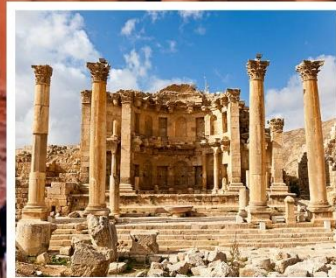
เมืองโรมันเจอร์ราช