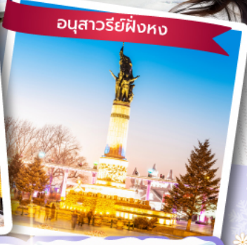
อนุสาวรีย์ผึ้งหง