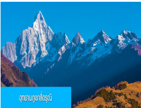
อุทยานกุเสีตรุณี

หลังอาหารนำท่านเที่ยวชม หุบเขาชวงเจียวโกว 双桥沟景区 ที่เป็นแหล่งท่องเที่ยวที่สวยงามที่สุดแห่งหนึ่งในเขตอุทยานกุเสีตรุณี นำท่านนั่งรถบั๊สของอุทยานที่วิ่งไปผ่านเส้นทางที่สร้างคู่ขนานกับลำธารภสยในหุบเขา ท่านจะได้สัมผัสกับความสวยงามของทัศนียภาพธรรมชาติที่หาชมได้ยาก โดยมีภูเขาหิมะสูงตระหง่านอยู่เบื้องหลัง ธารน้ำใสไหลริน และสระน้ำที่มีสีเขียวมรกต ในฤดูใบไม้ผลิและฤดูร้อนท่านจะได้เห็นฝูงจามรีท่ามกลางทุ่งหญ้าเขียวจี ส่วนในฤดูหนาวทุ่งหญ้าและพื้นดินจะปกคลุมด้วยพรมหิมะสีขาว....รถบั๊สของอุทยานจะนำนักท่องเที่ยวไปยังจุดชมวิวสำคัญต่าง ๆ ภายในเขตอุทยาน เพื่อให้นักท่องเที่ยวได้เที่ยวชมสถานที่และถ่ายรูปตามอัชฌาศัย จนครบแ่เวลา นำคณะขึ้นรถบั๊สออกจากอุทยาน