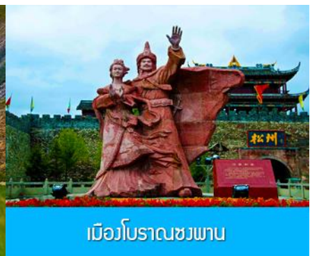
เมืองโบราณขงพาน

วันที่สาม อุทยานภูเขาสี่ตรุณี-ผ่านชมวิวภูเขาที่ราบสูง-ทะเลสาบเต๋อซี- เมืองโบราณขงพาน-เมืองชวงจู่ชื่อ