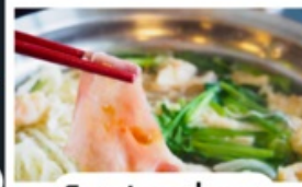
อาหารเข้าในห้องพักอาหารดิสนีย์