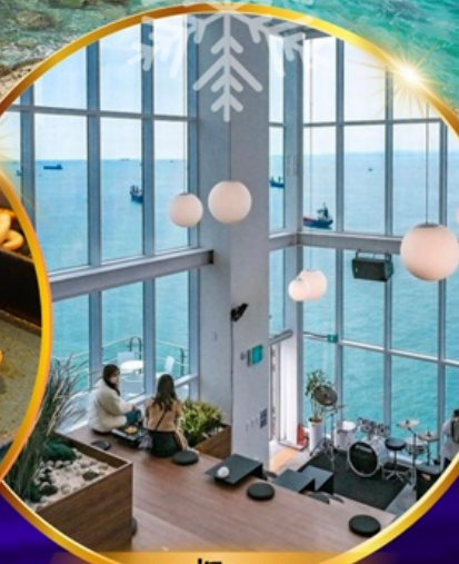
คาเฟ่วิวทะเล

ถ่ายรูปชิคๆ หมู่บ้านวัฒนธรรมคัมซอน เชคอิน คาเฟ่ริมทะเล วิวหลักล้าน ขึ้นเคเบิลคาร์ ชมทะเลปูซาน นั่งรถไฟบุกเบิก sky capsule ห้ามพลาด!! ตลาดปลาที่ใหญ่ที่สุด ชิมของอร่อยที่ตลาดแฮอนแด อิสระช้อปปิ้ง Lotte Duty Free