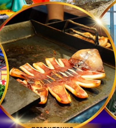
ตลาดแฮอนแด