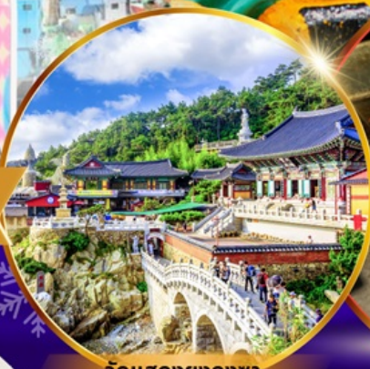
วัดแสงยงกุงซา