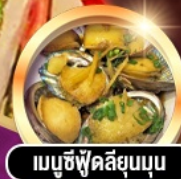
เมนูซีฟู้ดลิ้นขุน