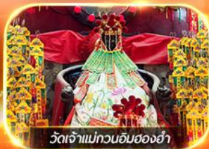
วัดเจ้าแม่กวนอิมสองฮ่า