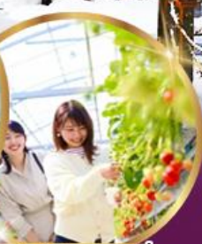
บูฟเฟต์ สตอเบอร์รี่ เก็บสดจากต้น

ราคา เดียว 45,919 บาท รวมภาษีมูลค่าเพิ่ม 7%