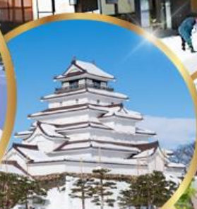
ปราสาท สึรุกะ