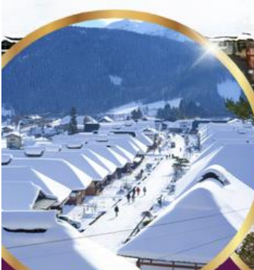
หมู่บ้านโบราณ โออูจิ จุกุ