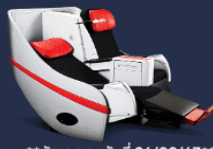
**อัฒเตน ณ วันที่ 26/02/67**

Premium Flatbed ที่นั่งสุดพิเศษขนาดที่กว้าง 19 นิ้ว ที่มีความห่างระหว่างแถว 59 นิ้ว สามารถปรับนอนได้เท่าที่ควรต้องการ พร้อมด้วยอุปกรณ์อื่นๆ ให้คุณเดินทางอย่างสะดวกสบายเต็มที่