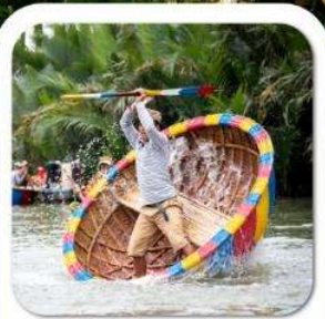
"ล่องเรือกระดิง"

นั่งกระเช้าที่ยาวที่สุดในโลก ขึ้นสู่บาน่าฮิลล์ • หมู่บ้านฝรั่งเศส • สวนสนุก FANTASY PARK LE JARDIN D'AMOUR • สะพานมือสีทอง • วัดหลินจิ้ง • เมืองโบราณฮอยอัน หมู่บ้านกิมถาน • ล่องเรือกระดิง • สะพานมังกร • APEC PARK • ตลาดฮาน