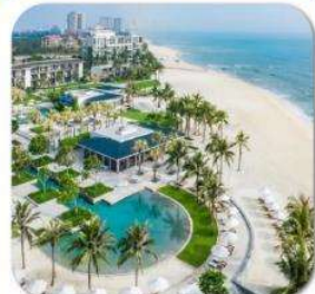
"พัก 5 ดาว HYATT DANANG 2 คืน"