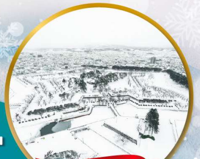
ป้อมโกเรียวกากุ

หมู่บ้านนิงเกิลเกอเรส • สวนสัตว์อาซาฮิยาม่า • ชมขบวนพาเหรดเพนกวิน ตลาดเช้าฮาโกดาเตะ • ป้อมโกเรียวกากุ • นั่งกระเช้าชมเมืองฮาโกดาเตะ ลานสกี • HILL OF BUDDHA • ไอตารุ • คลองไอตารุ • หมู่บ้านราเมน