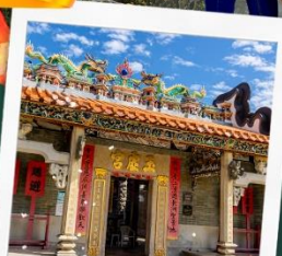
วัดปักไต้