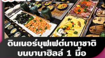
ดินเนอร์บุฟเฟ่ต์นานาชาติ บนบานาฮิลล์ 1 มื้อ