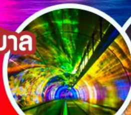
จูมงค์เลเซอร์