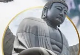
ชมเนินพระพุทธรเจ้า.. Hill of the Buddha