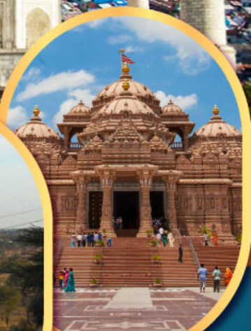
วิหารอักซาร์ดัม