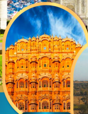
พระราชวัง สายลม