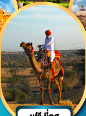
ฟรี ขี่อู เมืองมันทวา