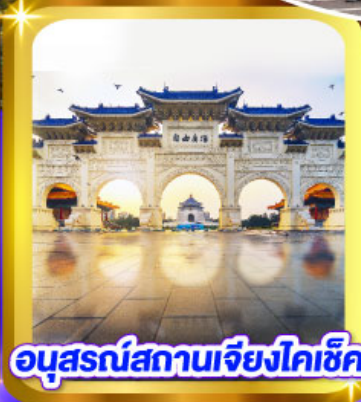
อนุสรณ์สถานเจียงไคเช็ก