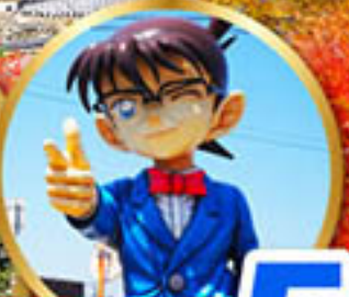
โคนันทาวน์