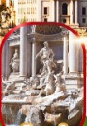
น้ำพุเทรวี่

เดินทาง 15-22 พ.ย.67 28 พ.ย. - 5 ธ.ค.67 26 ธ.ค.67 - 2 ม.ค.68(ปีใหม่) 28 ธ.ค.67 - 4 ม.ค.68(ปีใหม่)