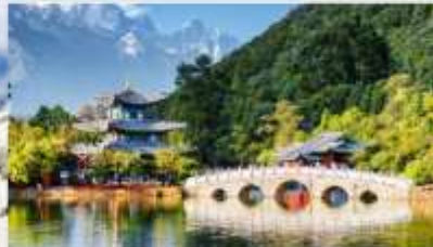
สระมิงกรดำ

*ทางบริษัทฯ ขอสงวนสิทธิ์ในการสลับโปรแกรมทัวร์ตามความเหมาะสมขึ้นอยู่กับสถานการณ์ปฏิบัติงาน โดยคำนึงถึงผลประโยชน์ของลูกค้าเป็นสำคัญ