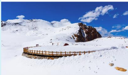
อุทยานตำกู่ปิงชว่น