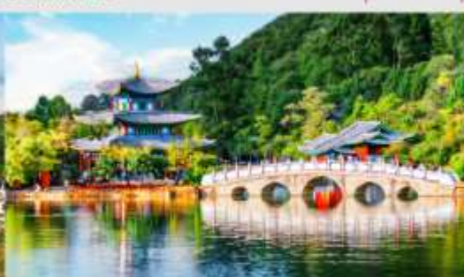
สระมิงกรต้า