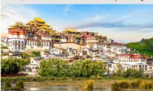
วัดลามะชงจ้านหลิน