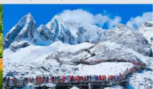
ภูเขาหิมะมังกรหยก