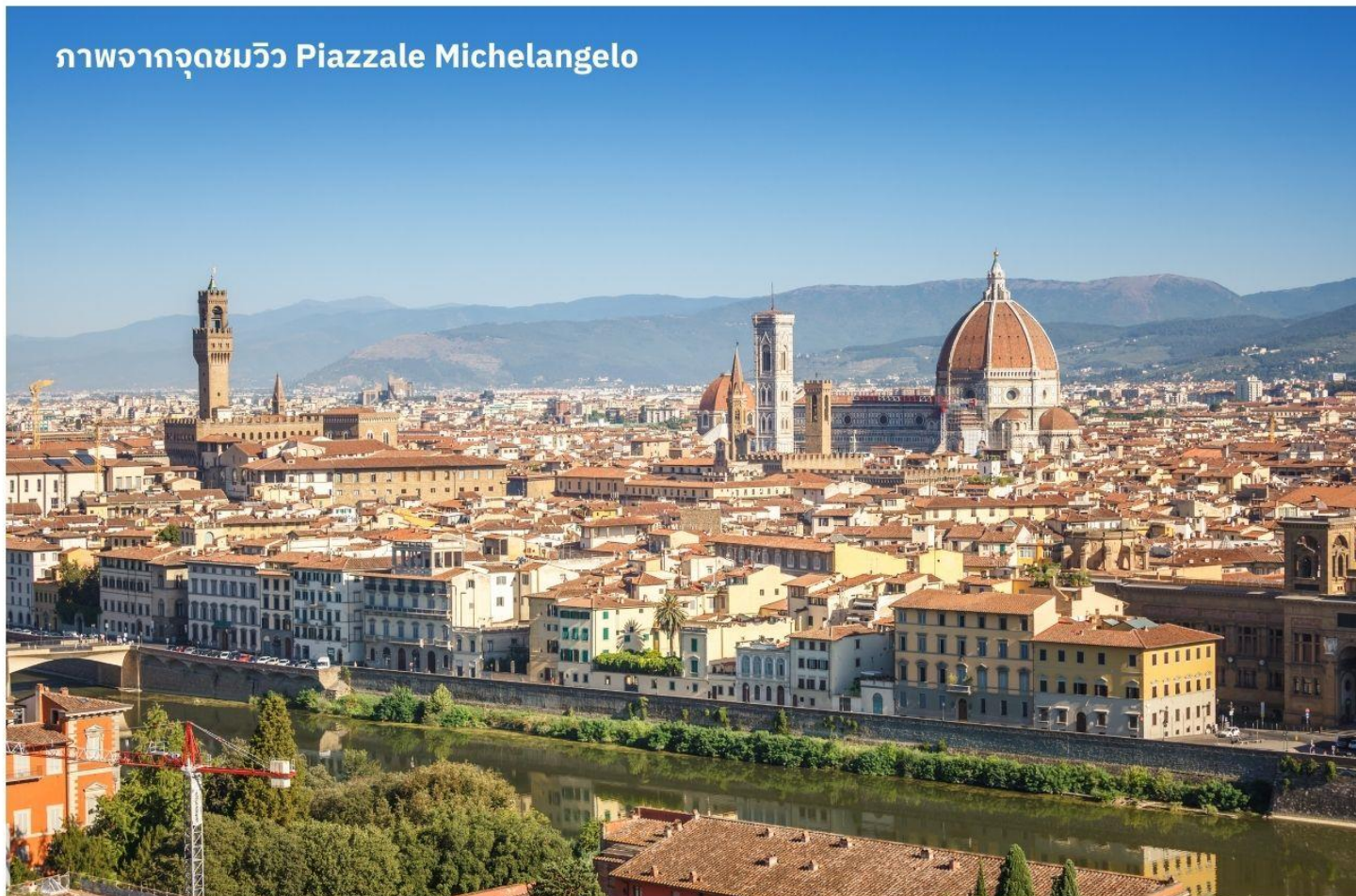
ภาพจากจุดชมวิว Piazzale Michelangelo

เมืองฟลอเรนซ์ ตั้งอยู่ทางตอนเหนือของประเทศอิตาลี เป็นเมืองที่มีชื่อเสียงในช่วงศตวรรษที่ 13-14 ซึ่งเป็นยุคที่เจริญรุ่งเรืองของวัฒนธรรมและศิลปะ อีกทั้งในอดีตยังมีความสำคัญทางการค้าและวัฒนธรรม มีสถาปัตยกรรมที่งดงามและเป็นที่มาของศิลปะโรแมนติกที่เจริญรุ่งเรืองอย่างมากในยุคนั้น นำท่านเดินทางไปยังเนินเขา Piazzale Michelangelo เพื่อชมวิวของเมือง Florence ที่นักท่องเที่ยวรวมไปถึงชาว Florence เอง มักขึ้นมาชมบรรยากาศในมุมสูงของเมือง ซึ่งจะเห็นหลังคาสีแดงของอาคารบ้านเรือนต่างๆ รวมไปถึง Duomo เรียงรายกันเป็นแนวสวยงามยิ่งนัก อีสาระให้ท่านเก็บภาพประทับใจตามอัธยาศัย