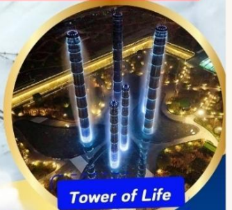
Tower of Life