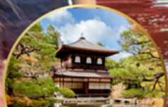
ชมสวนสไตลญี่ปุ่น.. Ginkakuji Temple