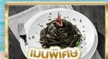
เมนูพิเศษ