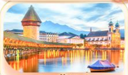
สะพานไม้ชาเปล