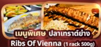
เมนูพิเศษ ปลาเทราต์ย่าง Ribs Of Vienna (1 rack 500g)