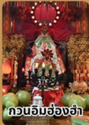
กวนอิมร้องไห้