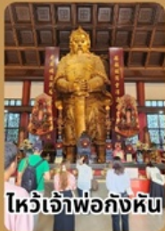
โห้วเจ้าพ่อกั้งหัน

กำหนดการเดินทาง ตุลา-ธันวา 2567 ต.ค.67 : 13-16 / 17-20 / 23-26 พ.ย.67 : 2-5 / 9-12 / 23-26 / 30 พ.ย.-3 ธ.ค. ธ.ค.67 : 7-10 / 14/17 / 21-24