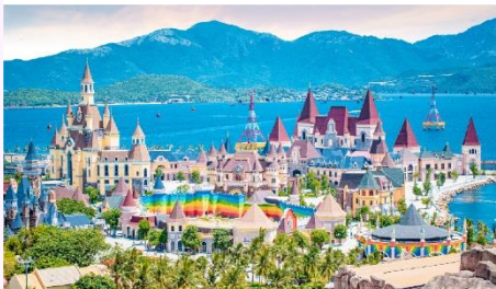
VinWonders NHA TRANG