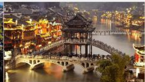
เมืองโบราณเฟิงหวง