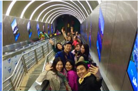
บันไดเลื่อนทะเลภูเขา

วันที่ 1 เมืองโบราณฝูหรงเจิน – ศูนย์ผลิตภัณฑ์ยางพารา– กระเช้าขึ้นเขาเทียนเหมินซาน – ระเบียงแก้ว เลียบหน้าผา – บันไดเลื่อนทะเลภูเขา – (เลือกซื้อโปรแกรม ออฟชั่น โชว์จิ้งจอกขาว)