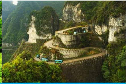
เส้นทาง 99 โค้ง