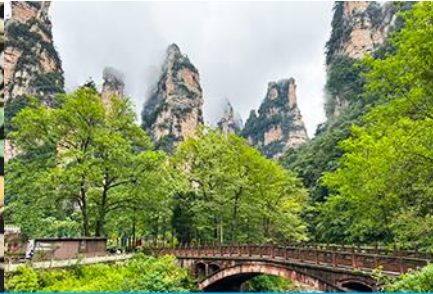
จุดชมวิวจินเปียนซี