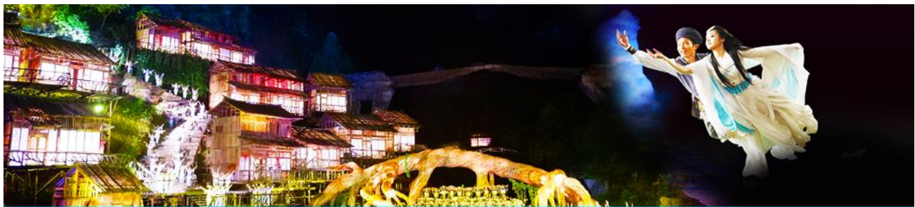
The Love Story of a Wooden Man and Fairy fox

จากนั้นท่านสามารถทดสอบกำลังขาของท่าน โดยการเดินลงบันได 999 ขั้น เพื่อลงมายังลานกว้างที่เป็นจุดถ่ายรูปด้านล่างของประตูสวรรค์ ท่านที่ไม่ต้องการเดินบันไดลง สามารถใช้บันไดเลื่อนแทนการเดินลงบันได 999 ขั้น ณ ลานกว้างด้านล่างเป็นจุดถ่ายรูปที่ดีที่สุดที่สามารถมองเห็นเขาประตูสวรรค์ได้อย่างชัดเจน จากนั้นนำท่านนั่งกระเช้าลงจากเขาเทียนเหมินซาน