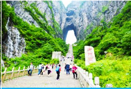
บันได 999 ขั้น