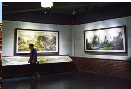
พิพิธภัณฑ์ภาพหินทราย