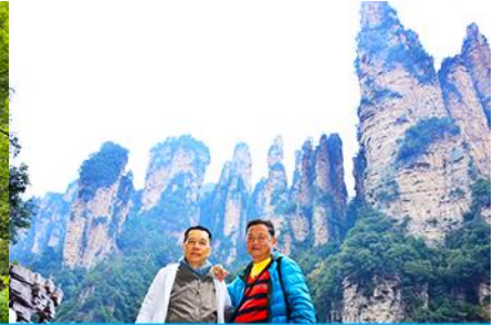
ชมจุดชมวิวลีฟท์แก้ว

วันที่ห้า เมืองจางเจียเจี้ย – เลือกซื้อโปรแกรมทัวร์เสริมออฟชั่น อุทยานอวตารจุดชมวิวจินเปียนซี–ชมจุดชมวิวลีฟท์แก้ว - ร้านอาหาร-ร้านใบชา-เดินทางกลับเมืองหยี่ซัง