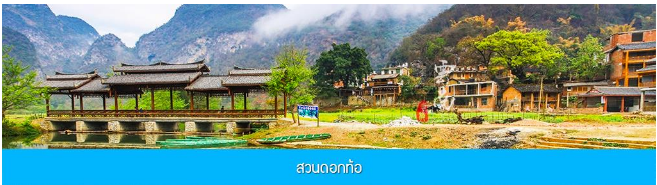
สวนดอกท้อ