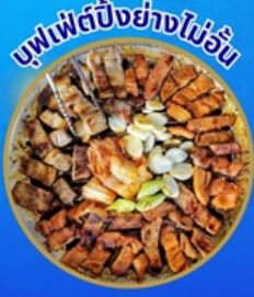
บุฟเฟ่ต์ปิ้งย่างไม่อั้น