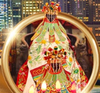
ยืมเงินเจ้าแม่กวนอิมฮ่องกง