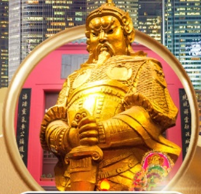
วัดเซกตงหนิว